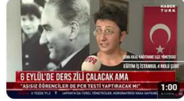
HABERTÜRK - EĞİTİM İŞ İSTANBUL 4 NOLU ŞUBE OKULLARIN AÇILMASI... 554 görüntüleme • 2 yıl önce