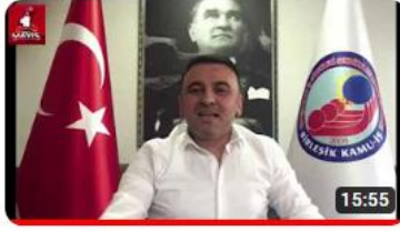
Birleşik Kamu İş İstanbul İl Başkanlığı 1 Mayıs 2021'e Özel Anma Videosu