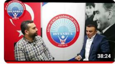
Bir Konu / Bir Konuk: PANDEMİYE ÖĞRETMEN GÖZÜ İLE BAKIŞ ANKET... 188 görüntüleme • 2 yıl önce