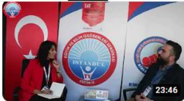
Konuk; Sevdâ Ketenci / Okul Öncesi Alan Sorunları - Son Örgütlenme... 227 görüntüleme • 2 yıl önce