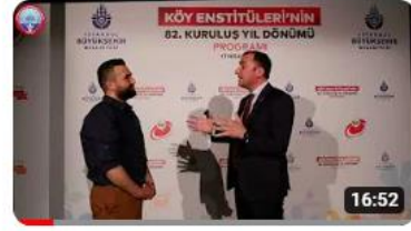
Eğitim İş MYK ve İstanbul Şube Başkanlarımız: Köy Enstitüleri Özel...