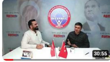
Öğretmenler Odası: Reşat Nuri Güntekin-Yeşil Gece incelemesi /... 667 görüntüleme • 1 yıl önce