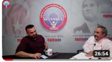
Uzman Öğretmen/Başöğretmen Sınavları Soru Cevap/ Konuk: Maksut... 8,9 B görüntüleme • 1 yıl önce

( https://www.youtube.com/@egitim-isistanbultv3049/videos )