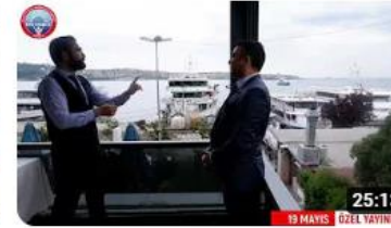
19 MAYIS ÖZEL YAYINI. BANDIRMA VAPURUNA BİNİŞ VE SAMSUN'DA İL...