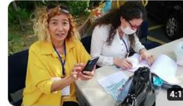
Eğitim İş İstanbul 04'Nolu Şube Üyelere Teşekkür Anı Videosu