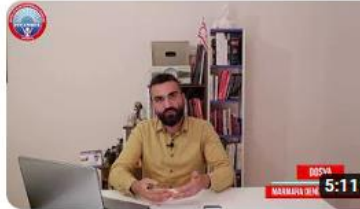
Dosya: Marmara Denizinde Müsilaj / #1.Bölüm