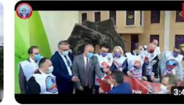
Birleşik Kamu İş İstanbul İl Başkanlığı 1 Mayıs 2021 Anı Videosu