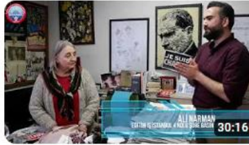
1 Mayıs İşçi Bayramı / Emek Dayanışma Günü Özel Yayını Konuk:...