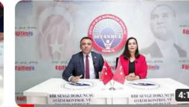
Eğitim İş - Bir Sevgi Dokunuşu Otizm Kontrol ve Önleme Merkezi İş Birliği...