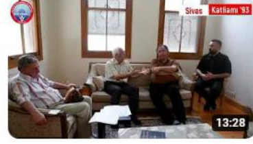
Sivas Katliamının 29. Yılında Karaağaç Dergahında Aydınları Andık