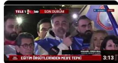
Eğitim İş İstanbul Şubeleri/ Karanlıkta Eğitime Karşı Basın Açıklamamız (21... 3:13