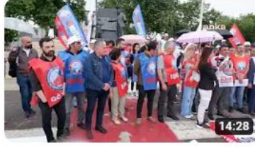
BİRLEŞİK KAMU İŞ TÜİK BASIN AÇIKLAMASI